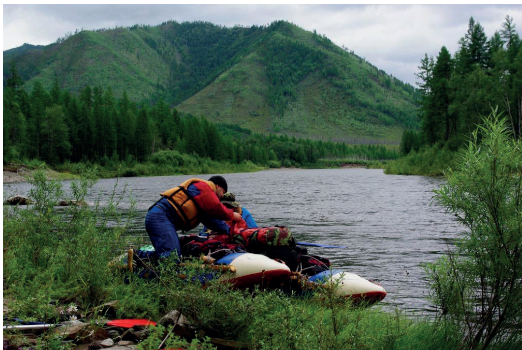
Сплав по северной реке Котера