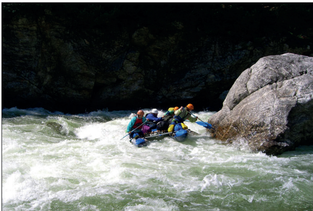
Пороги на р. Снежная.