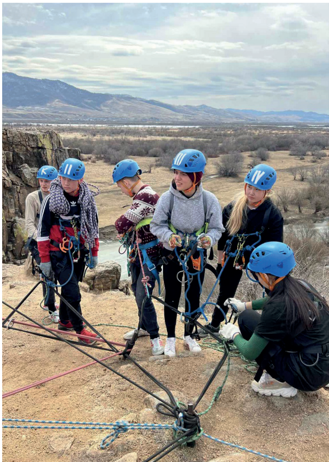
Соренования по горному туризму на Тологое