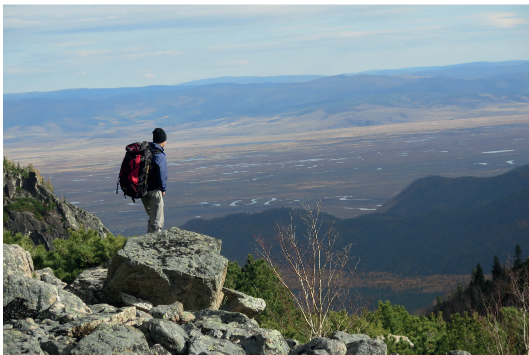
Вид на Баргузинскую долину