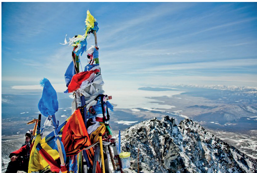
На вершине Мунко-Сардык