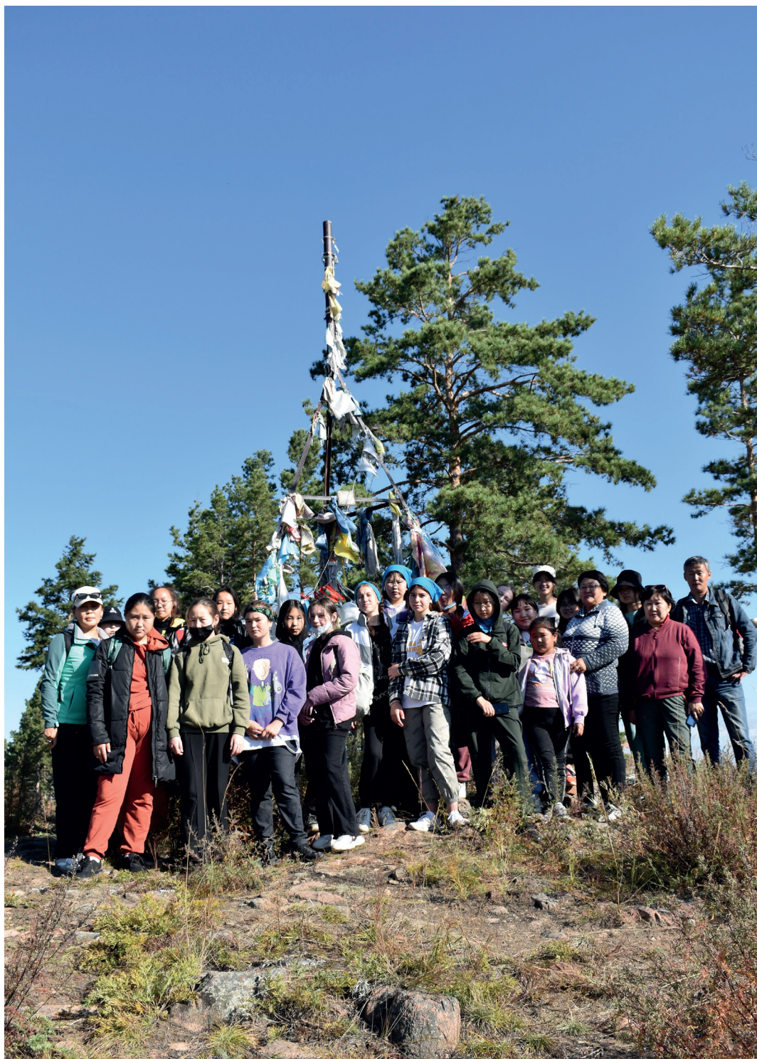
В окрестностях Медведчиковой пади