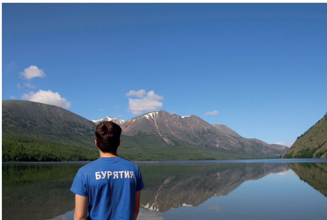
оз. Шутхулай, Окинский район