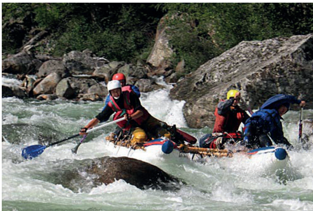
Река Хара-Мурин начинается на Хамар-Дабане