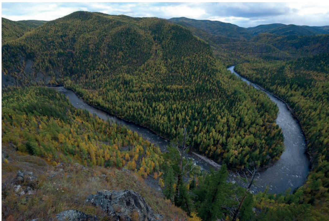
Река Темник делает крутые повороты.