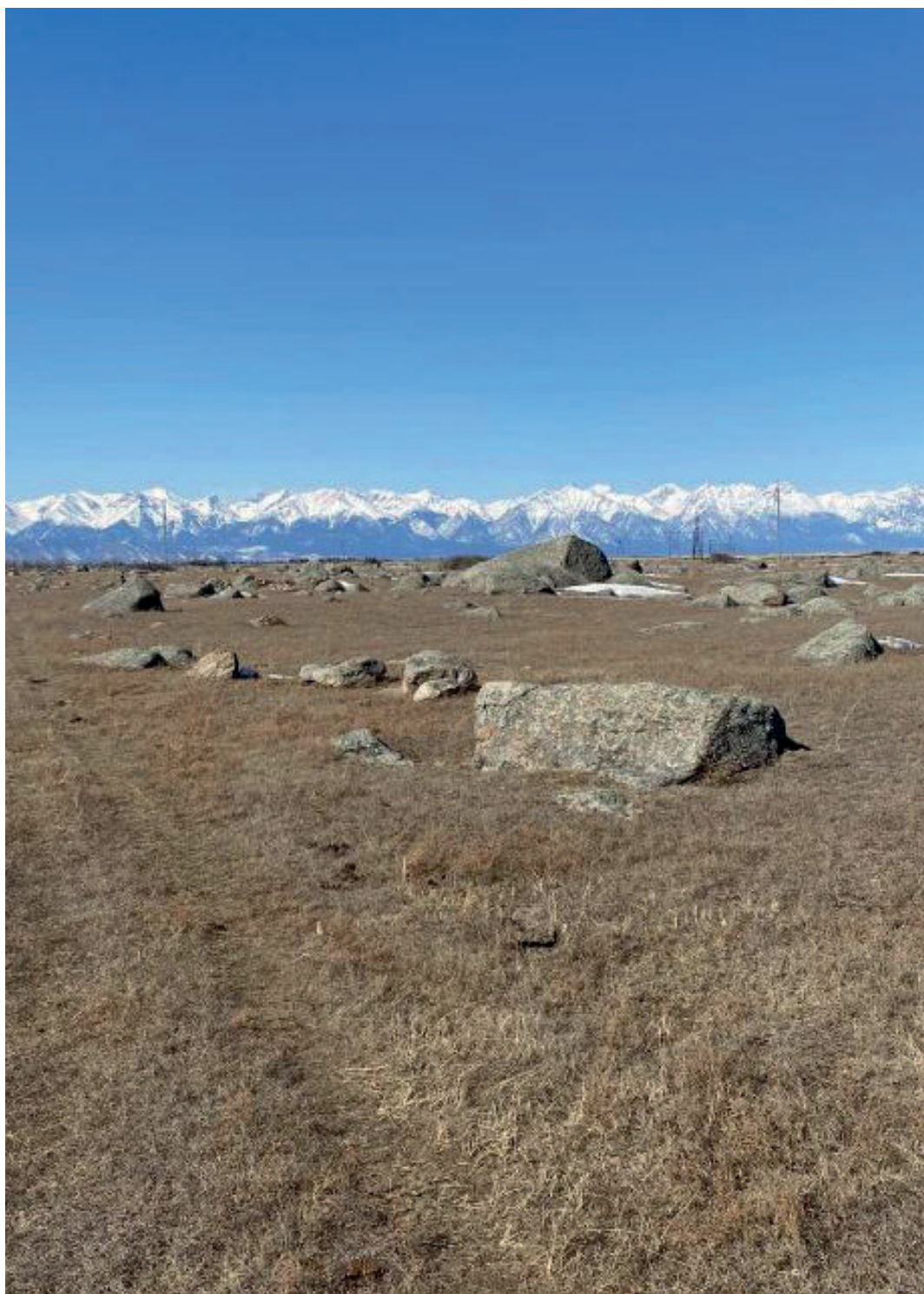
Ининский сад камней