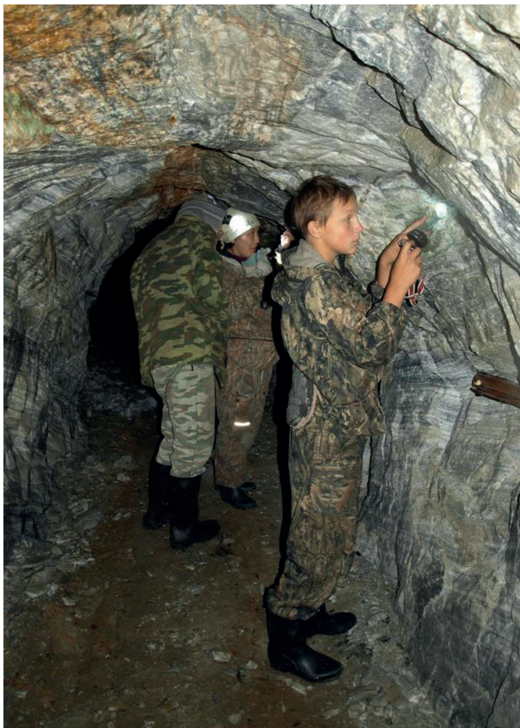
В пещере Долганская яма