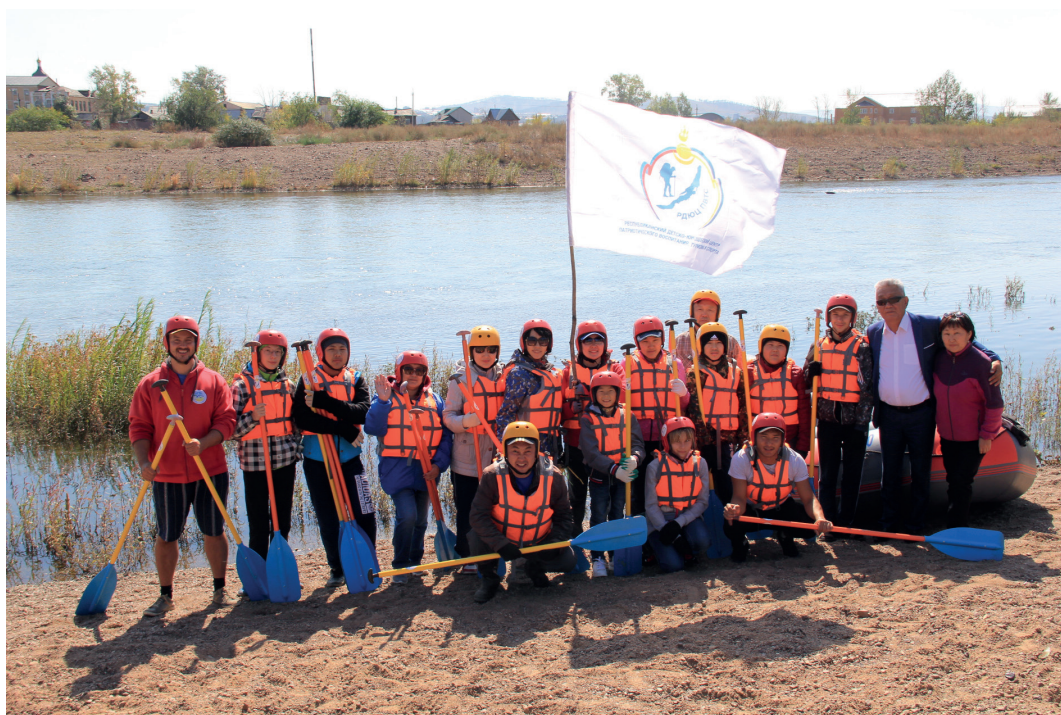
Слав для детей с ограниченными возможностями по р.Селенга