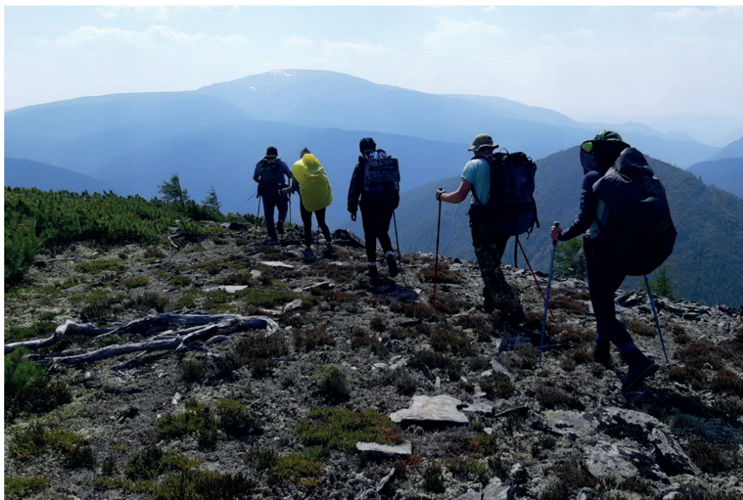
По Икатскому хребту