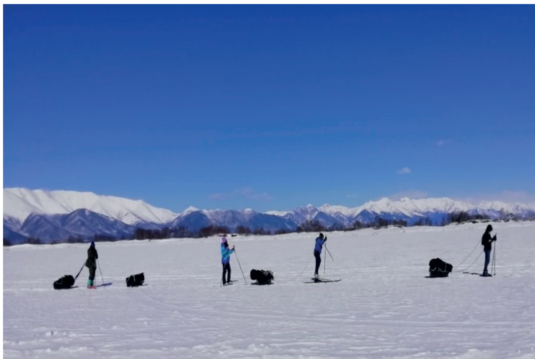
Вдоль архипелага Ярки