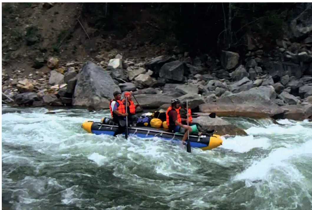
В верховьях реки Баргузин